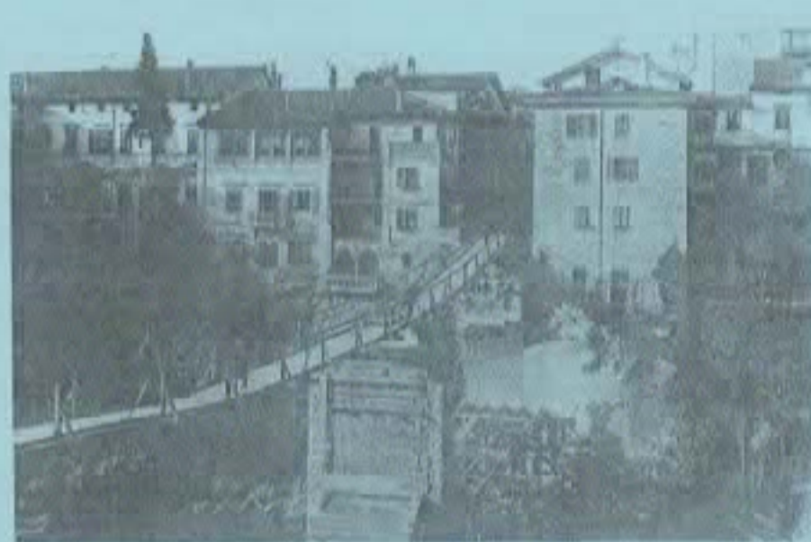
Il P.d.D. dopo la ritirata di Caporetto – 1917