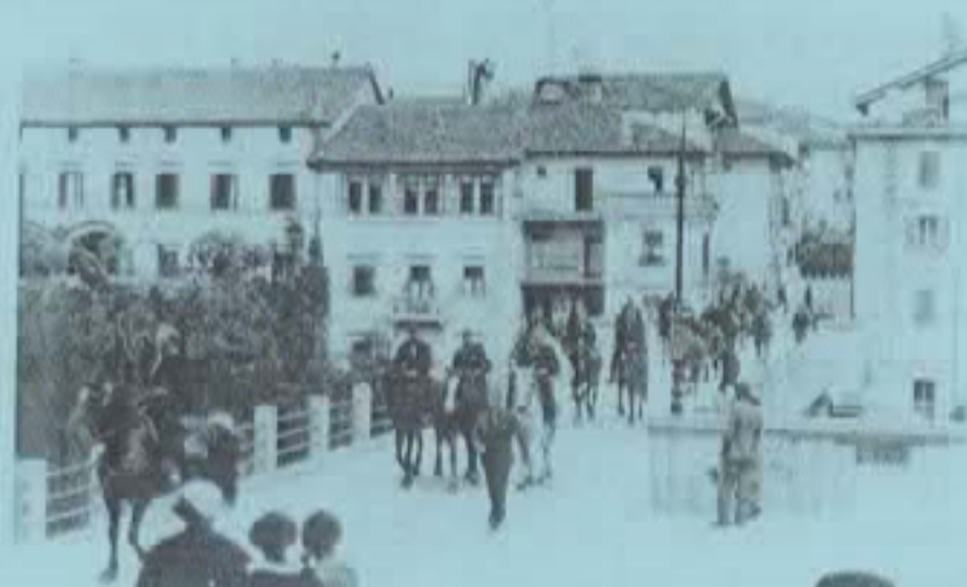
Il P.d.D. tra le due Guerre Mondiali