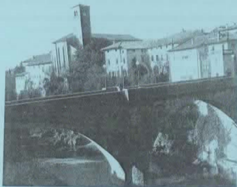
Il P.d.D. nel 2005