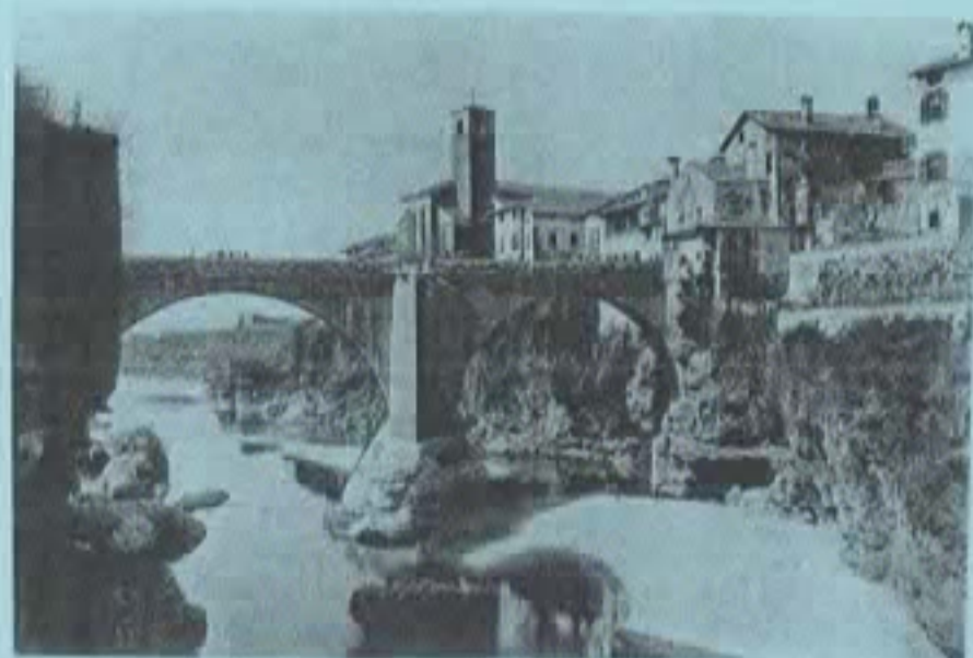
Il P.d.D. nel 1905