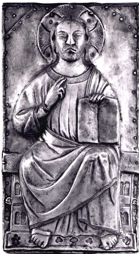
Copertura di un evangelario del secolo XIV - Cividale - Museo Cristiano

Giugno 2007 Lettera del Presidente N. 341