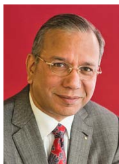
Il Presidente 2015/2016 del Rotary International K.R. "Ravi" RAVINDRAN (RC Colombo - Sri Lanka)