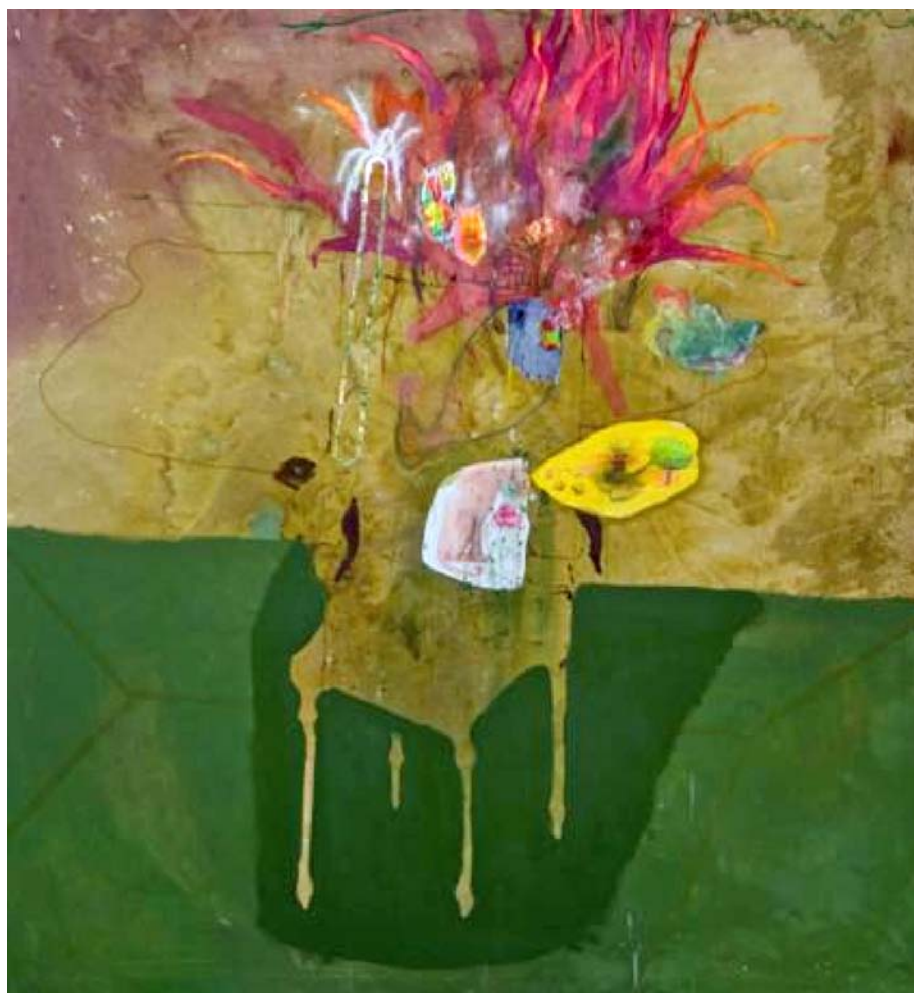
Valerio Nicolai Non due volte per la stessa cosa 2011